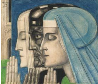
Jan Toorop, "Gebed"