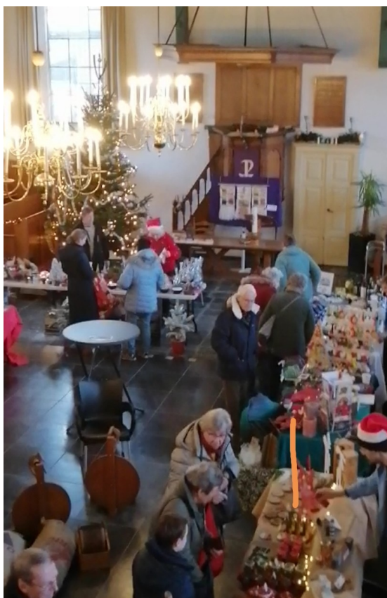
Impressie Kerstmarkt 16 december 2023